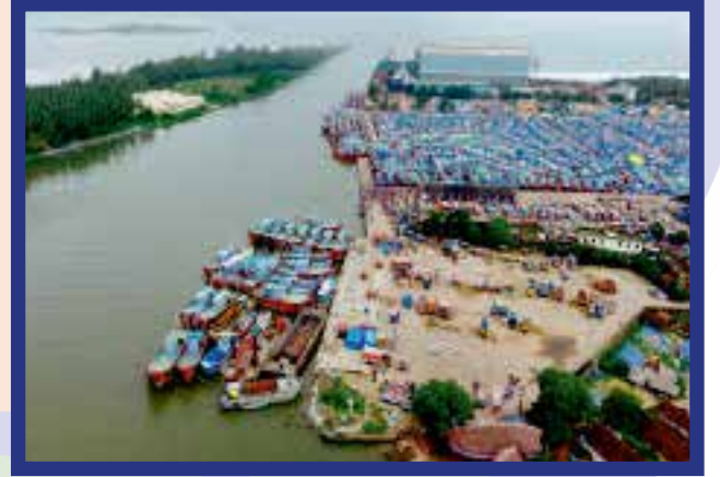
ಮೀನುಗಾರರ ಶ್ರೇಯೋಭಿವೃದ್ಧಿಗಾಗಿ ಹಲವು ಜಿಟ್ಟಿಗಳನ್ನು ಮೇಲ್ದರ್ಜೆಗೇರಿಸಲಾಯಿತು