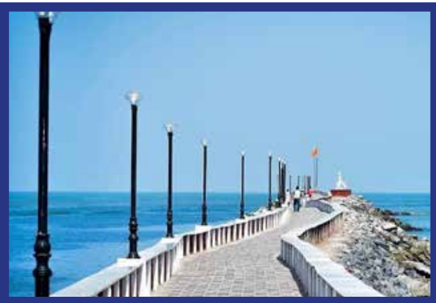
ಉಡುಪಿಯ ಪಡುಕೆರೆಯಲ್ಲಿ ರಾಜ್ಯದಲ್ಲೇ ಮೊದಲ ಸೀ ವಾಕ್ ವೇ ಪಾಯಿಂಟ್ ನಿರ್ಮಾಣ