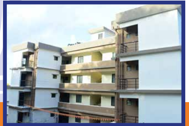
ಪ್ರಧಾನ ಮಂತ್ರಿ ಆವಾಜ್ ಯೋಜನೆಯಡಿ ವಸತಿ ರಹಿತರಿಗೆ 500 ಫ್ಲ್ಯಾಟ್‌ಗಳ ನಿರ್ಮಾಣಕ್ಕೆ ಭೂಮಿ ಮಂಜೂರು