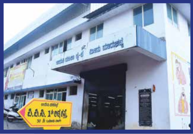
ಉಡುಪಿ ಪೇಟೆಯಲ್ಲಿ ಮೇಲ್ದರ್ಜೆಯ ಮೀನು ಮಾರುಕಟ್ಟೆ ನಿರ್ಮಾಣ